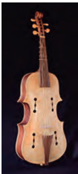
Violón Ibérico. Segundo orixinal do Mosteiro da Encarnación (Ávila), S. XVII (atrib. Domingo Pescador). 5 cordas. Cinco trastes. Tiro: 705 mm. Prezo: 7.000 €