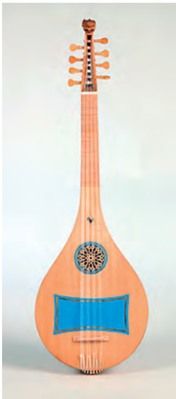
Mandora Segundo iconografía: Fra Angelico (Virxe da Humildade, 1433-1435) Catro ordes Tiro: 576 mm. Prezo: 2.500 €