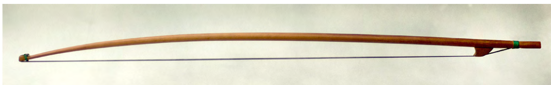
Arco para viola soprano

Os meus arcos renacentistas son o resultado do estudo de diversas fontes iconográficas, principalmente pinturas dos séculos XV e XVI. Están feitos con madeiras europeas. Crina negra. As crinas podense destensar recolocando a noz.