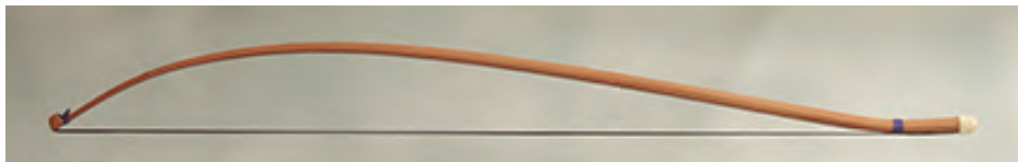
Arco de Vyola: lonxitude 770 mm; peso 50 - 60 gr.