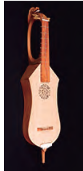
Cítola Pazo de Xelmirez (s. XIII) Santiago de Compostela Tiro: 462 mm. Catro órdes. Prezo: 3.000 €