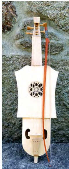
Violeta de Santa Catarina de Vigri (1433-1435) Catro cordas Tiro: 305 mm. Prezo: 3.000 €