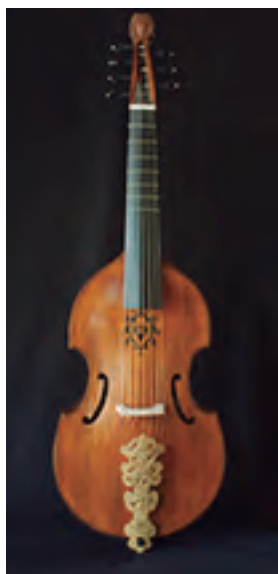
Viola da Gamba baixo francesa. Segundo M. Colichon (nais do século XVII) 7 cordas Táboa harmónica en cinco pezas dobradas. Tiro: 720 mm. Prezo: 9.500 €