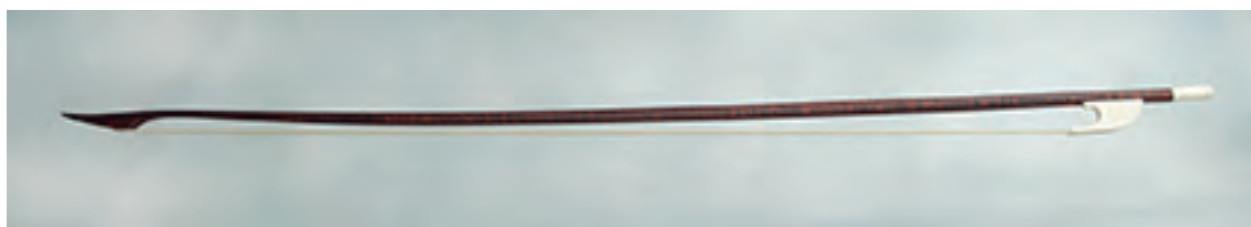
Arco de viola da gamba baixo

Lonxitude: 775 mm; peso: 90 - 94 gr; crina: 660 mm.