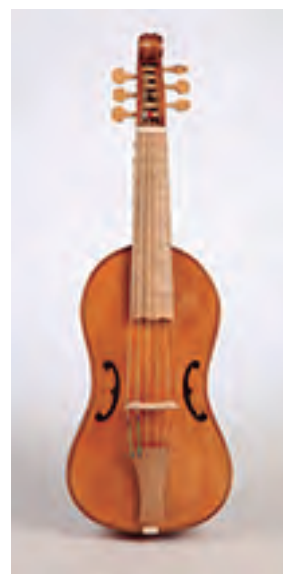
Viola da Gamba soprano Segundo G. M. da Brescia (c. 1575) 6 cordas Tiro: 320 cm. Prezo: 3.200 €

Prezo: 4.500 € No prezo está incluída toda a ornamentación.