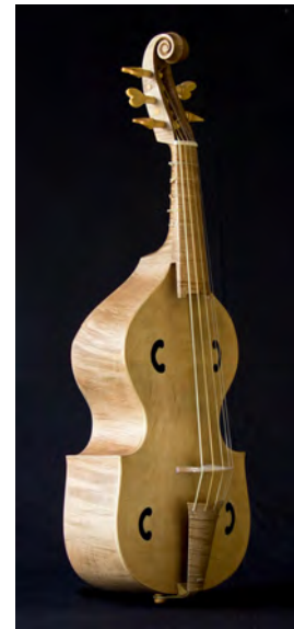
A partir do instrumento representado no cuadro "A harmonía" ou "As tres gracias" ( Hans Baldung 1484/85-1545, Museo del Prado, Madrid). Tiro de 350 mm, cinco cordas e cinco trastes. Prezo: 3.200 €