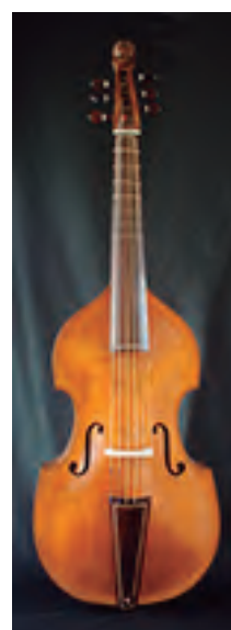
Viola da Gamba baixo alemá. Segundo Jacob Stainer (colección privada) 6 cordas Táboa harmónica en dúas pezas talladas. Tiro: 710 mm. Prezo : 9.800 €