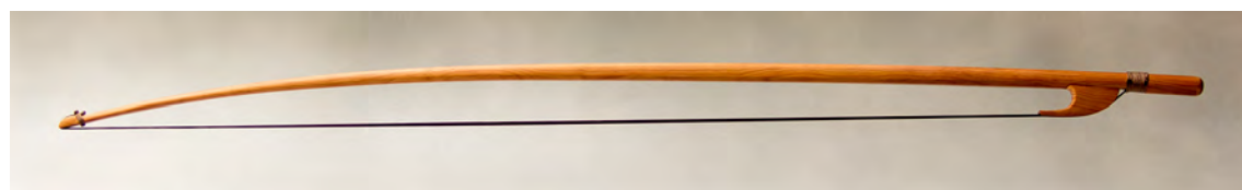
Arco para viola tenor

Lonxitude total aproximada: 780 mm; peso: 64 - 70 gr; crina: 660 mm