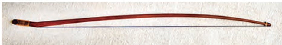
Arco para Vyola grande: lonxitude: 770 mm; peso: ± 84 gr.