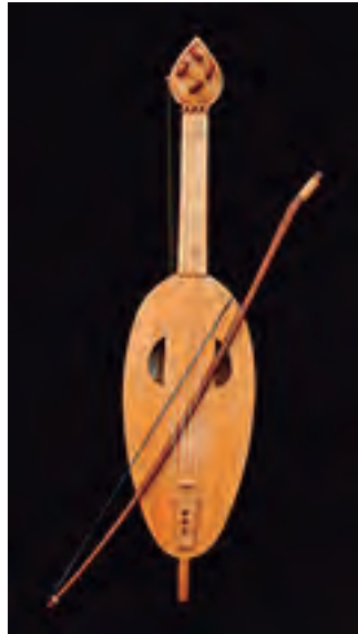
Vyola grande Pazo de Xelmirez (s. XIII) Santiago de Compostela Tiro: 565 mm 4 cordas (1 bordón). Prezo: 3.500 €