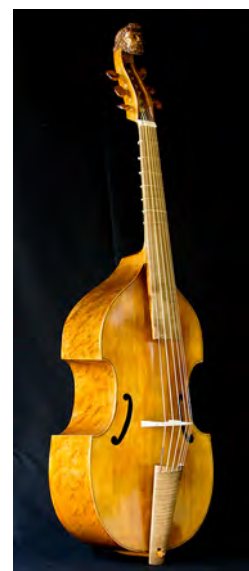
Viola da Gamba Tenor. Segundo J. Rose 1598 6 cordas Tiro: 580 mm. Prezo: 5.500 €