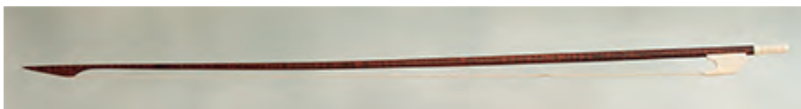
Arco de viola da gamba baixo

Lonxitude: 790 mm; peso: 95 - 98 gr; crina: 665 mm.