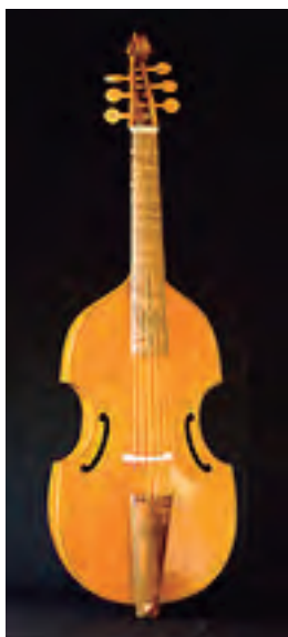
Viola da Gamba baixo inglesa. Segundo John Rose (c. 1600) 6 cordas Táboa harmónica en sete pezas dobradas. Tiro: 710 mm. Prezo: 8.500 €