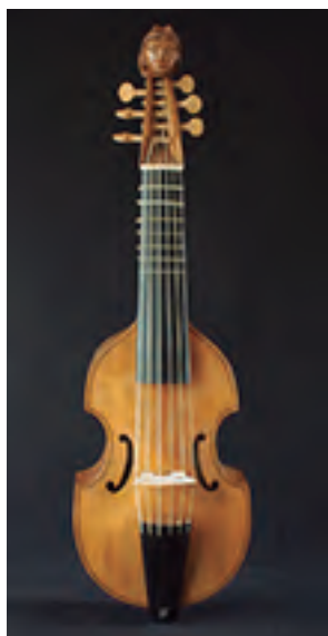
Pardessus de Viole Segundo N. Bertrand (1753) 6 cordas Tiro: 320 mm. Prezo: 3.000 €