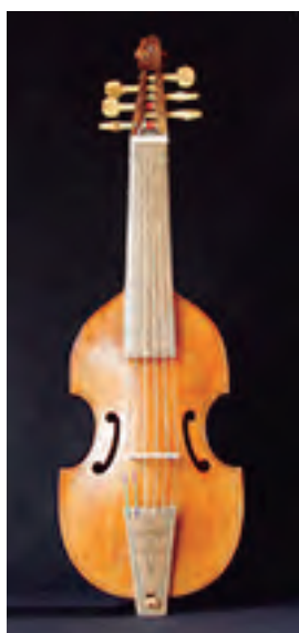
Viola da Gamba soprano Segundo H. Jaye 6 cordas Tiro: 360 mm. Prezo: 3.500 €